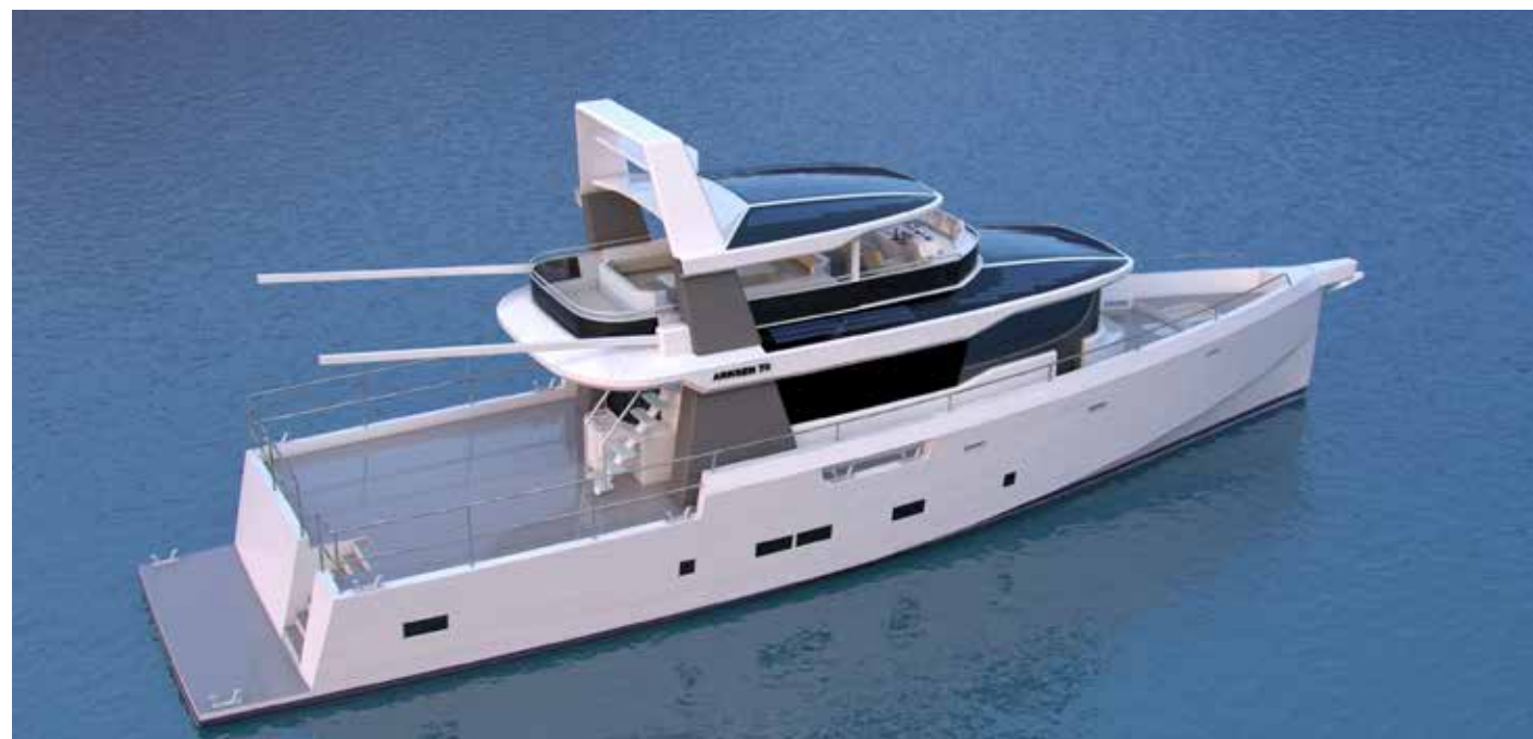
Sopra il rendering dell'Arksen 100 visto dall'alto. A sinistra, in basso e nella pagina a fianco, quelli dell'Arksen 70.