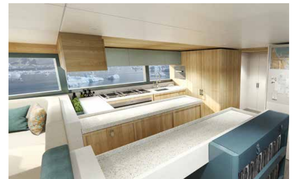
These pages, renderings of the Arksen 85. At 22.66m, it can accommodate up to 14 people depending on the layout configuration.